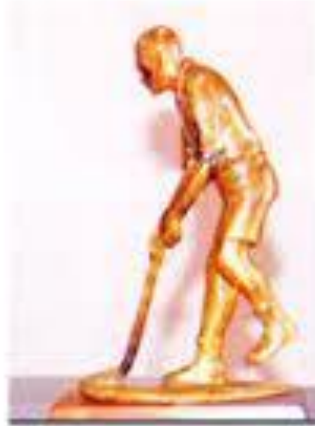
DHYAN CHAND AWARD